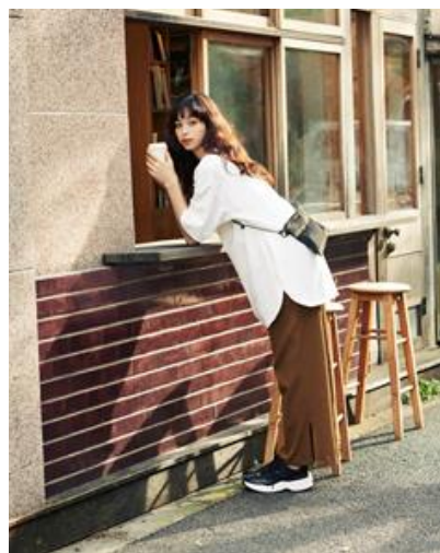
W ヘビーウェイトオーバーサイズ T(5) ¥1,490