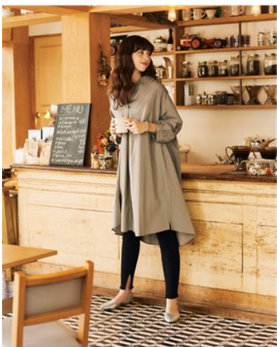
WA ラインシャツワンピース(7) ¥2,990

ジーユーの「リブスリットパンツ」は、レギンスのほか、ストレートや、ワイドシルエットの3種類を取り揃えています。カラーもベーシックカラーに加え、今年トレンドのエクリュカラーやブラウンなど幅広く取り揃えている為、カジュアルにも、モードにも、自分にあった着こなしを楽しむことができます。