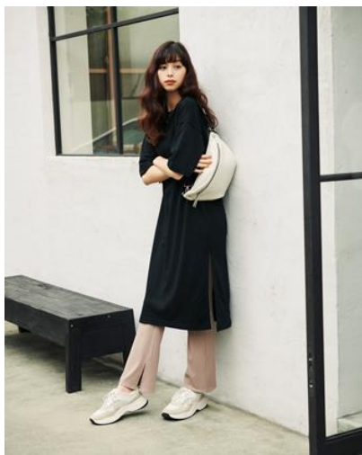
W スリット T ワンピース(S) ¥1,990